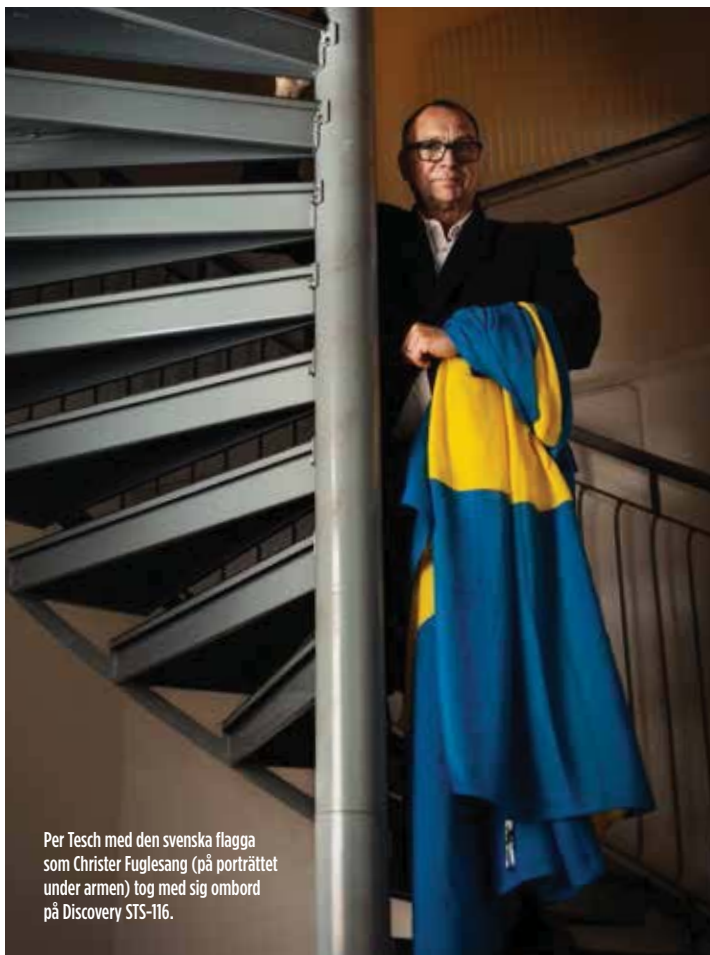
Per Tesch med den svenska flagga som Christer Fuglesang (på porträttet under armen) tog med sig ombord på Discovery STS-116.